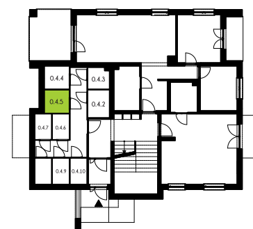
Parter Komórka lokatorska